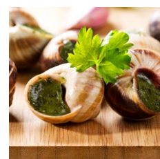
Bløddyr (snegle, muslinger, østers m.m.)