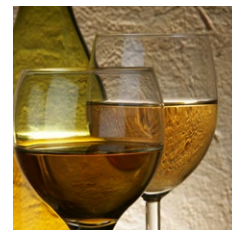
Svovldioxid og sulfitter over 10 mg/ kg eller liter (f.eks. i vin)