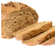
Korn- produkter med gluten- indhold