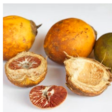
Skalfrugter / nødder