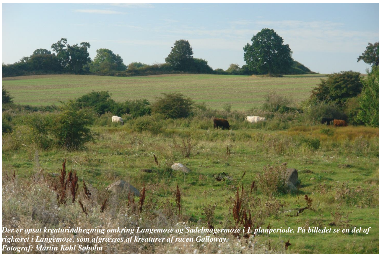
Der er opsat kreaturindhegning omkring Langemose og Sadelmagermose i 1. planperiode. På billedet se en del af rigkæret i Langemose, som afgræsses af kreaturer af racen Galloway.

Indsatsen udføres af lodsejeren i området og gennemføres i videst muligt omfang gennem frivillige aftaler. Der findes blandt andet en række tilskudsordninger, som kan søges gennem NaturErhvervstyrelsen.