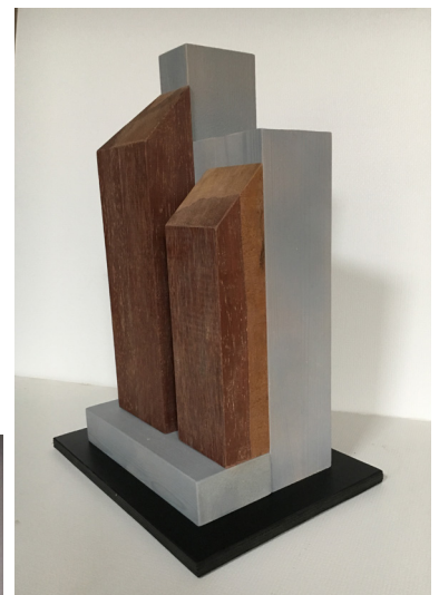
Silo set fra bugten/nordøst