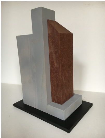
Silo set fra byen/sydvest

Hermed opnår man, at siloen fra land står urørt og fortæller, at der her engang har været et meget aktivt havneliv.